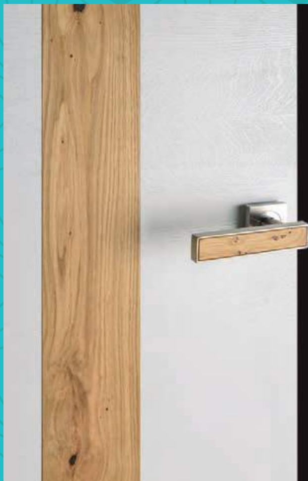
Signature bois authentique, Chêne sélectionné brossé, finition blanc satin. Poignée Palanges