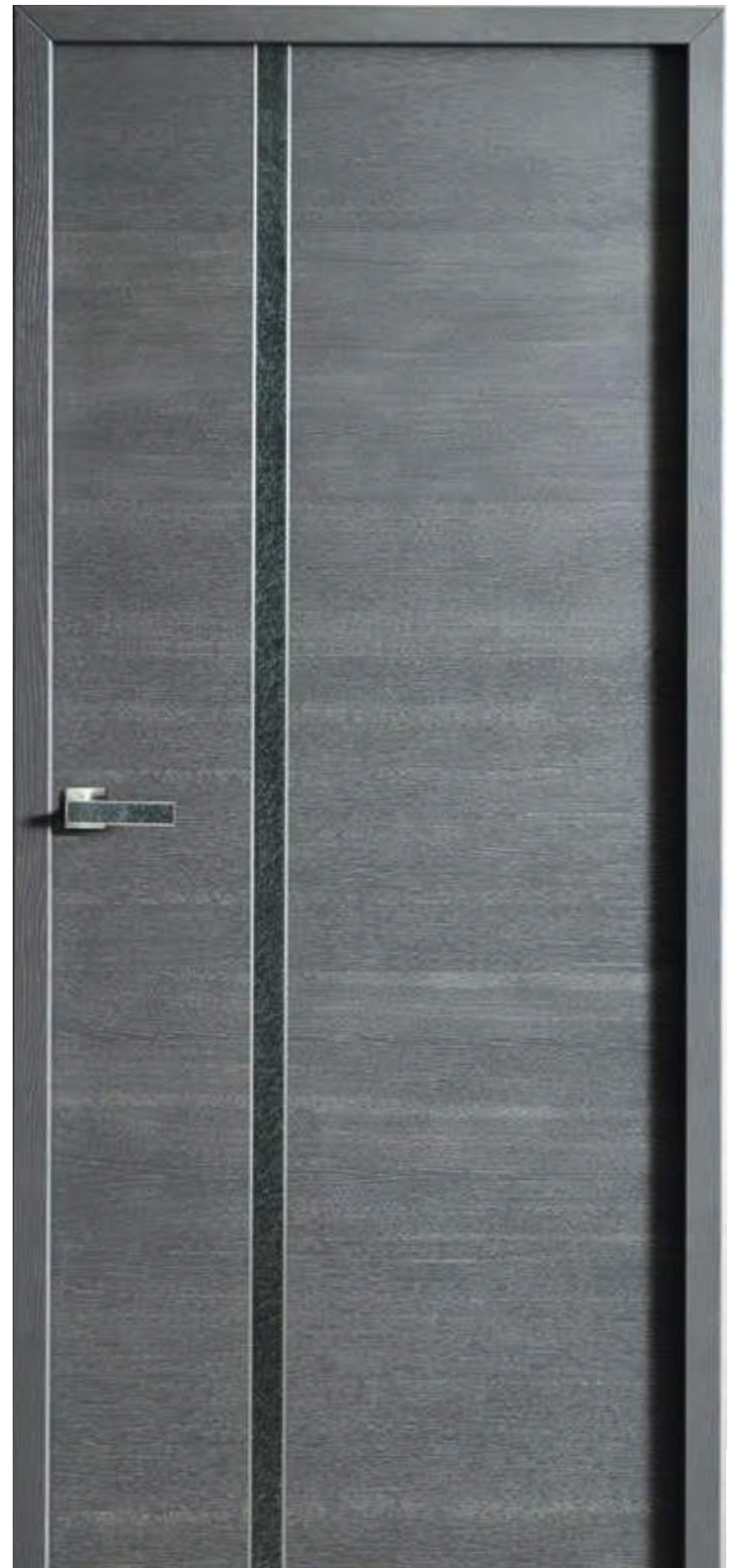
Chêne sélectionné gris perle brossé

Découvrez les finitions disponibles page 62