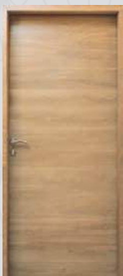
Epure Chêne sélectionné