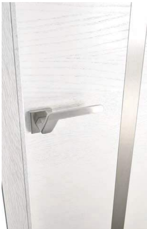
Signature inox en Chêne sélectionné brossé finition blanc satin. Poignée Lods