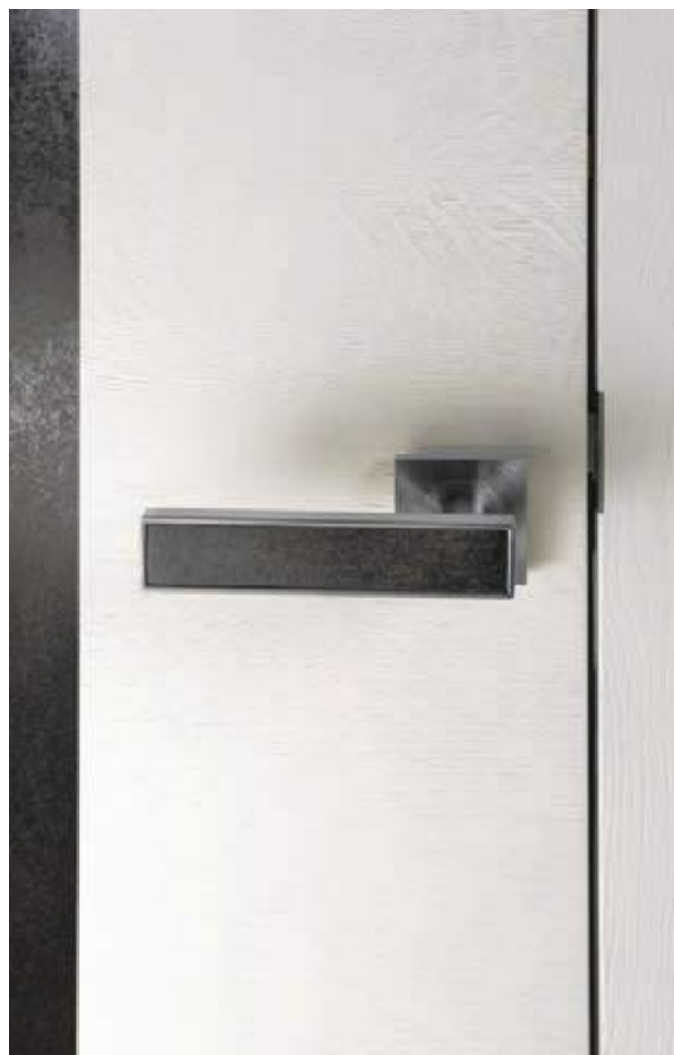
Signature céramique en Chêne blanc satin brossé. Poignée Ceramica