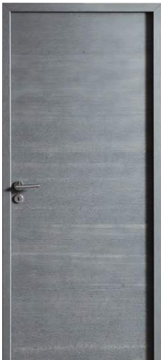
Chêne sélectionné brossé finition gris perle