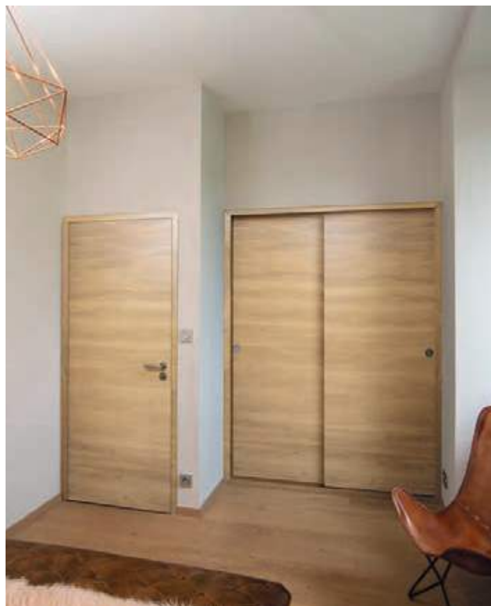
Epure Chêne sélectionné, Chêne naturel brossé