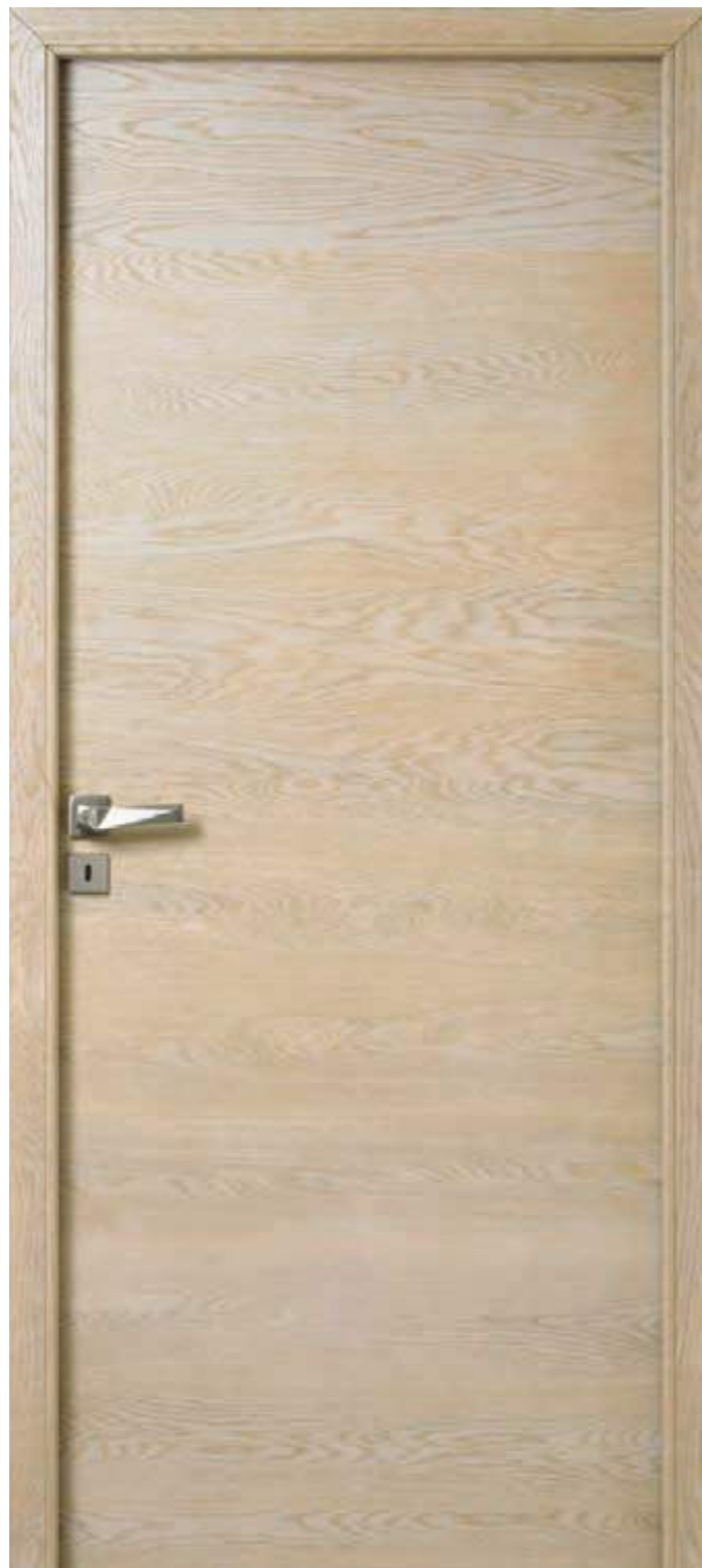
Chêne sélectionné blanchi brossé Poignée Coaraze

Découvrez les finitions disponibles page 62