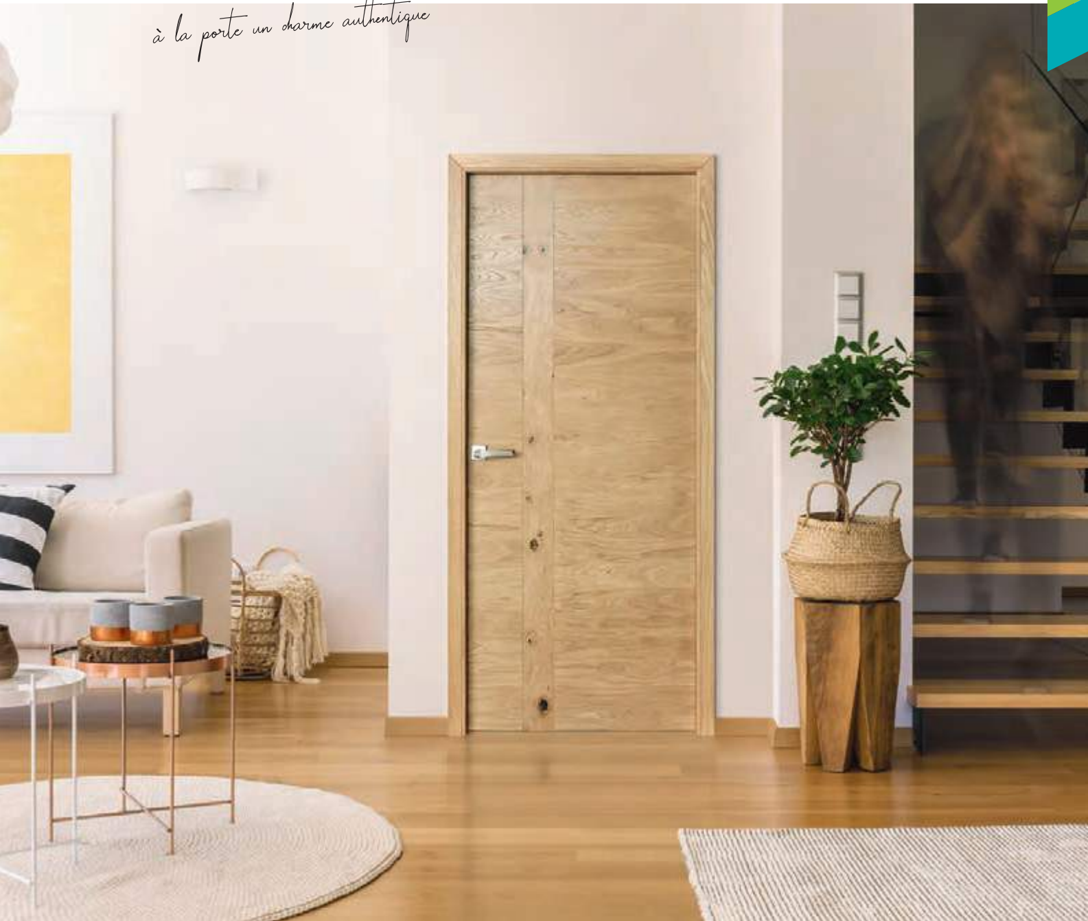
Signature bois authentique, Chêne naturel brossé sélectionné

Rozière révèle la beauté du bois... Meticuleusement sélectionnés les gros nœuds se répartissent sur le bandeau vertical et offrent à la porte un charme authentique