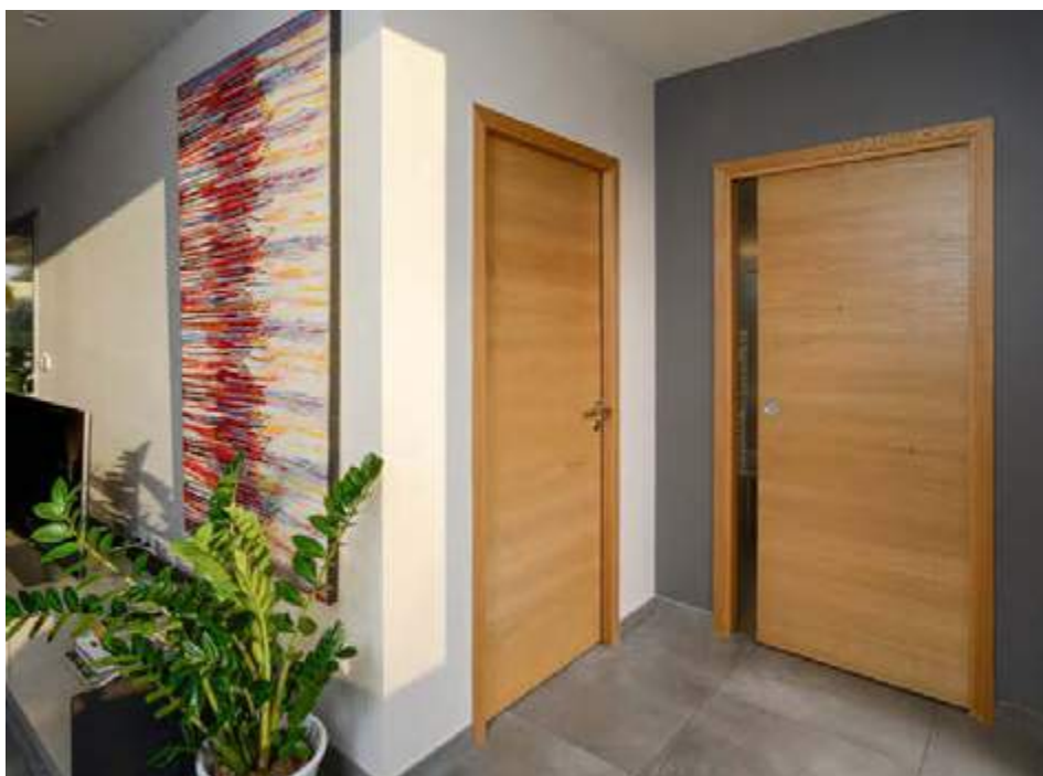
Epure bi-matière Chêne sélectionné clair

Indications et photographies non contractuelles, voir p. 94