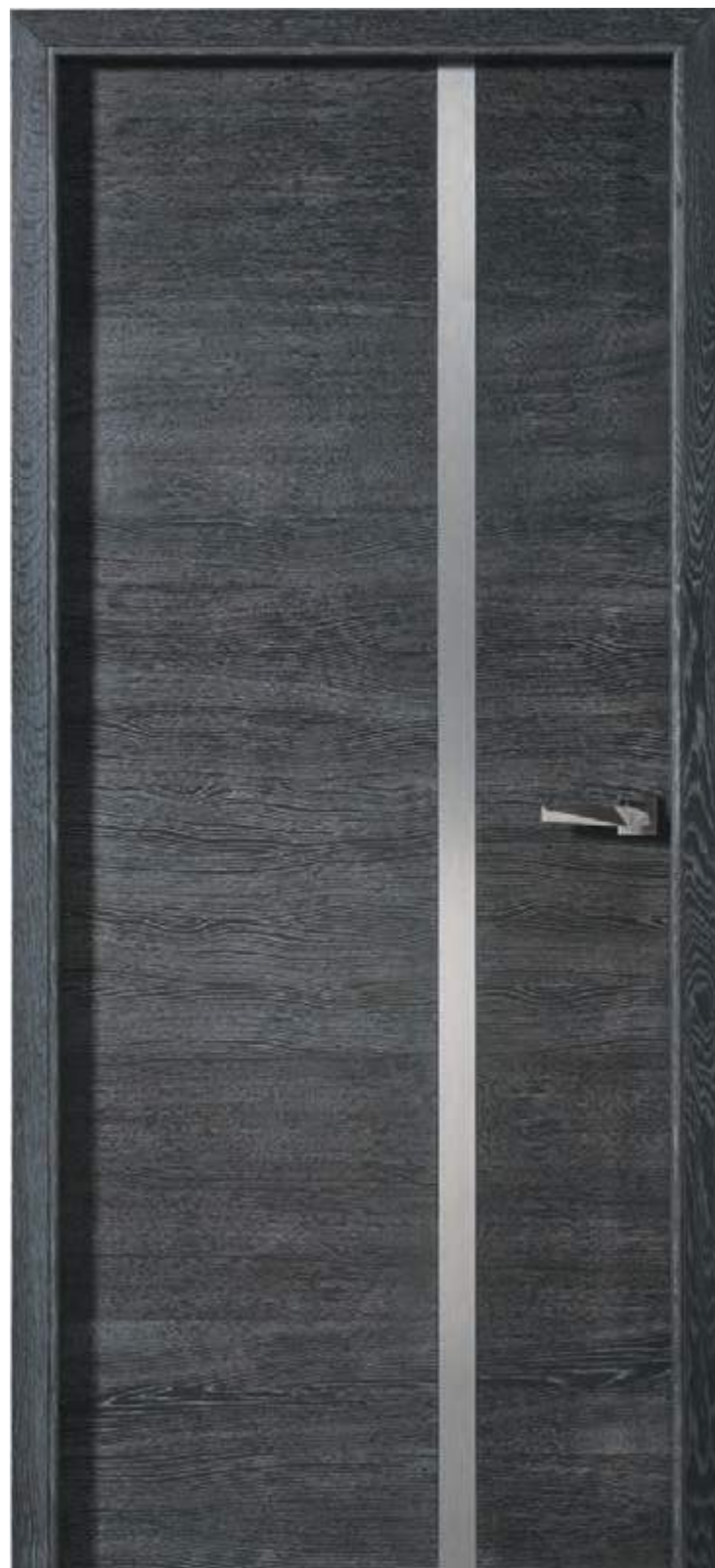
Signature inox en Chêne ardoise brossé