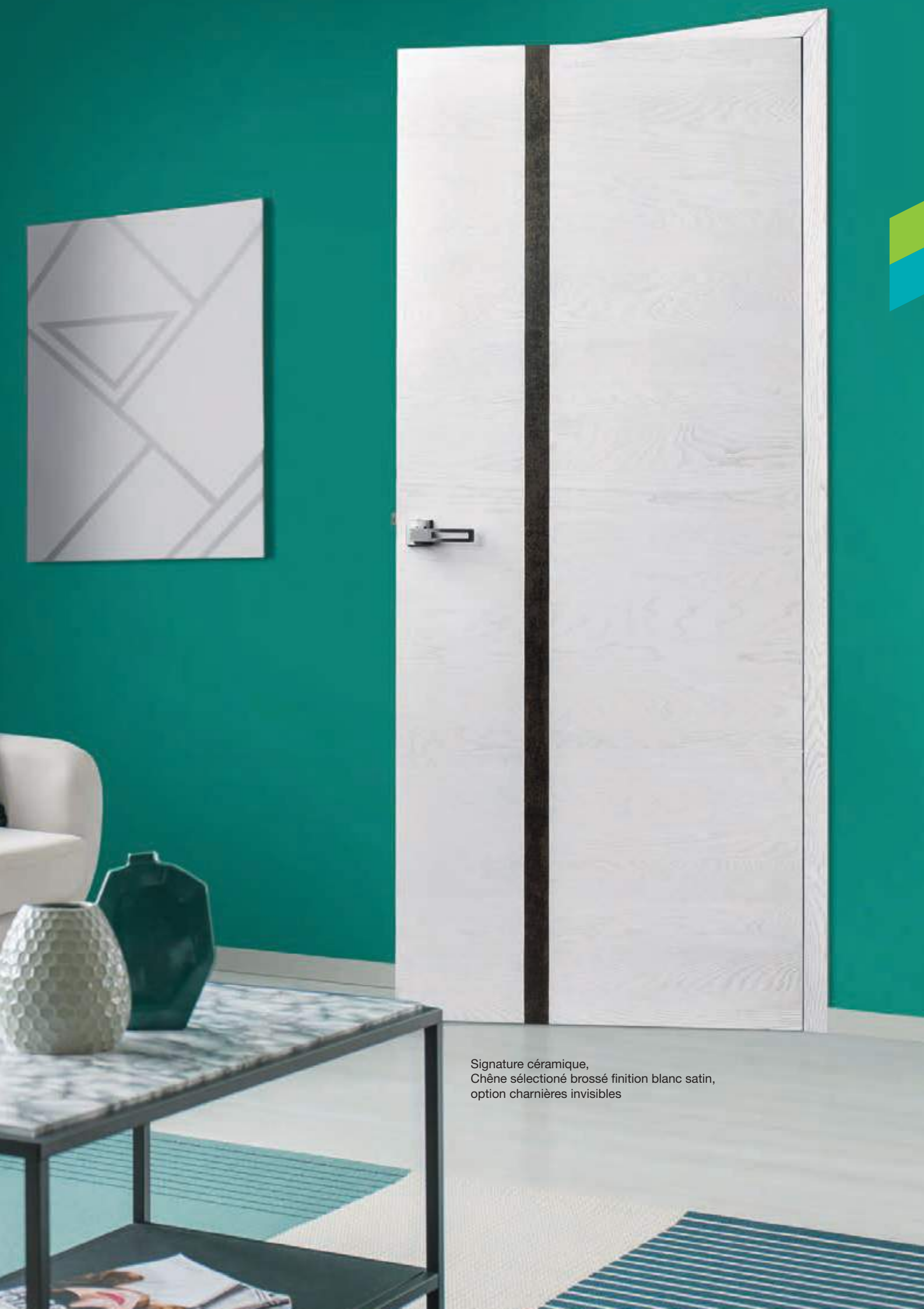
Signature céramique, Chêne sélectionné brossé finition blanc satin, option charnières invisibles