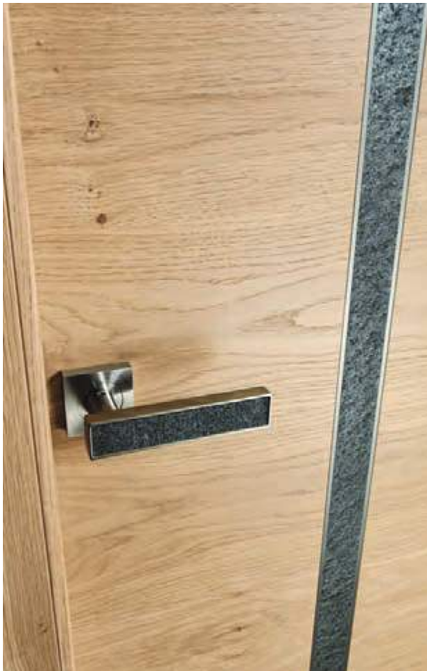
Signature minéral en Chêne sélectionné naturel brossé Poignée Piedra