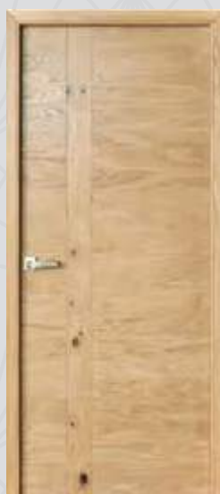
Signature bois authentique*