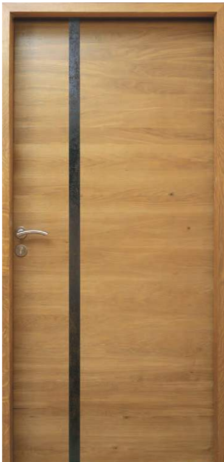
Chêne clair sélectionné brossé