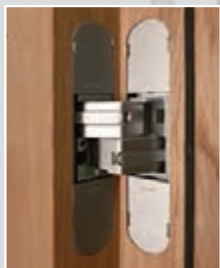
Charnière invisible aspect argenté

Apportez de la finition et du design à vos portes grâce aux charnières invisibles