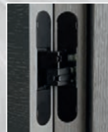
Charnière invisible noire