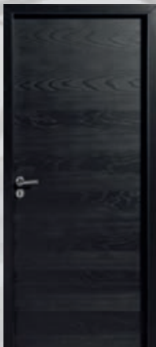
Epure® bloc-porte avec parement en Sapin, isotherme climat B classe 2

Choix de l'essence de bois : Sapin lisse, Sapin brossé ou Chêne brossé