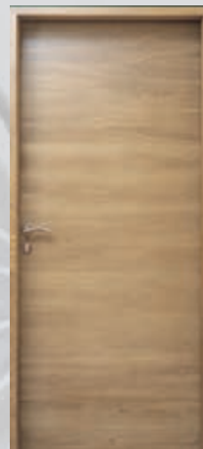
Epure® bloc-porte avec parement Chêne naturel brossé