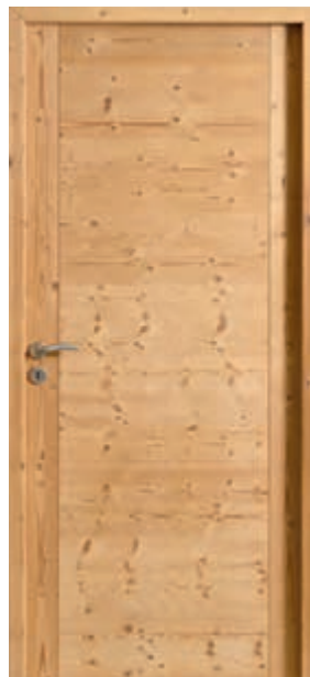
Epicéa thermo-chauffé brossé

Rive droite en standard, disponible à recouvrement sur demande sur thermo-chauffée uniquement