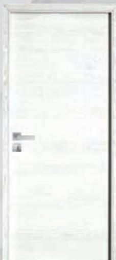
Epure® Chêne blanc satin