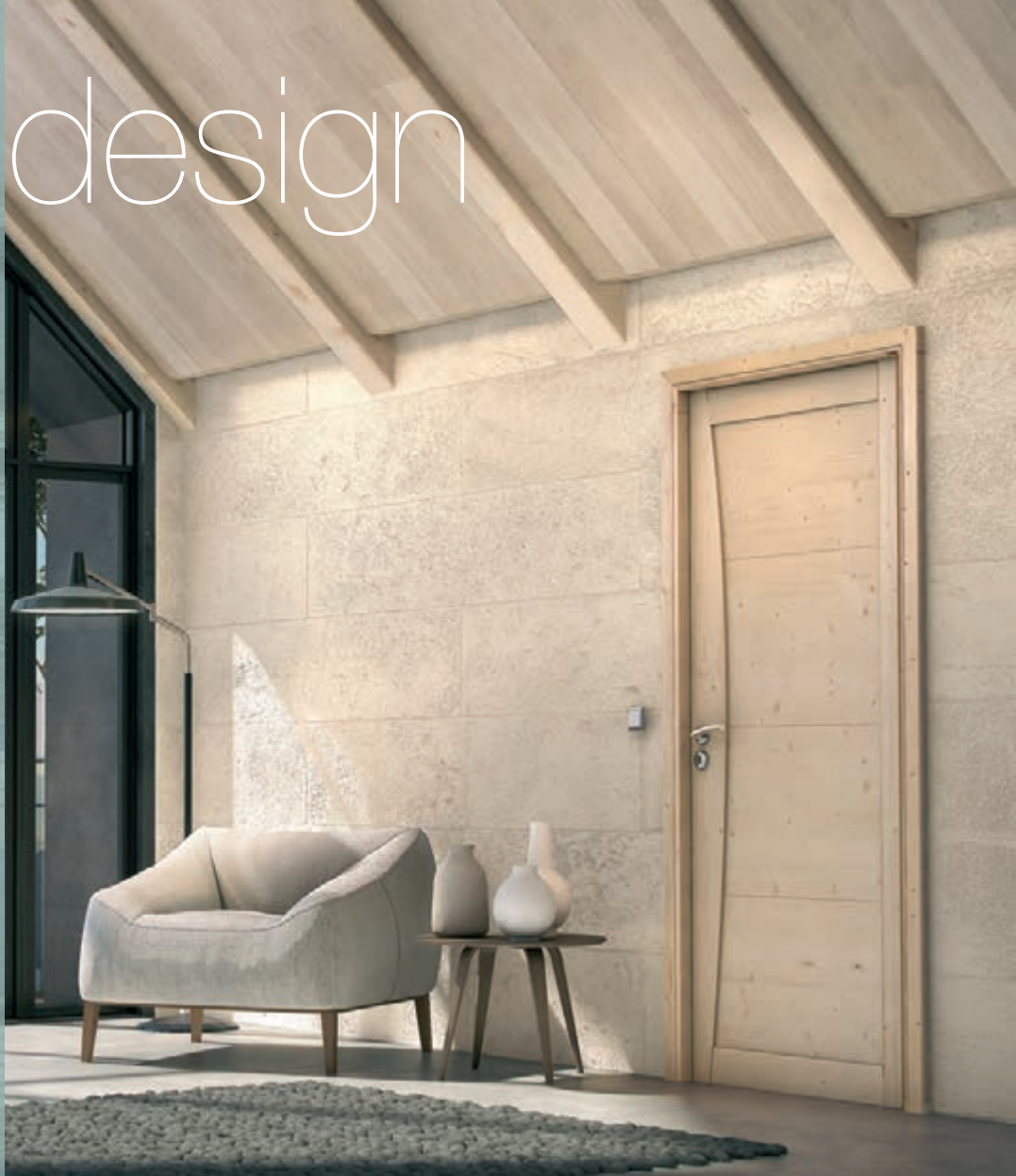
Mistral scandesign, Epicéa brut

Une touche de modernité, un air de Scandinavie, c'est le subtil mélange qui s'invite chez scandesign. Retrouvez les modèles aux lignes design à l'état brut dans cette collection au style résolument « scandesign ».