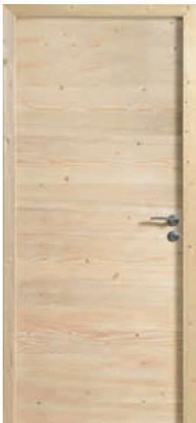
Epicéa brut Rive droite