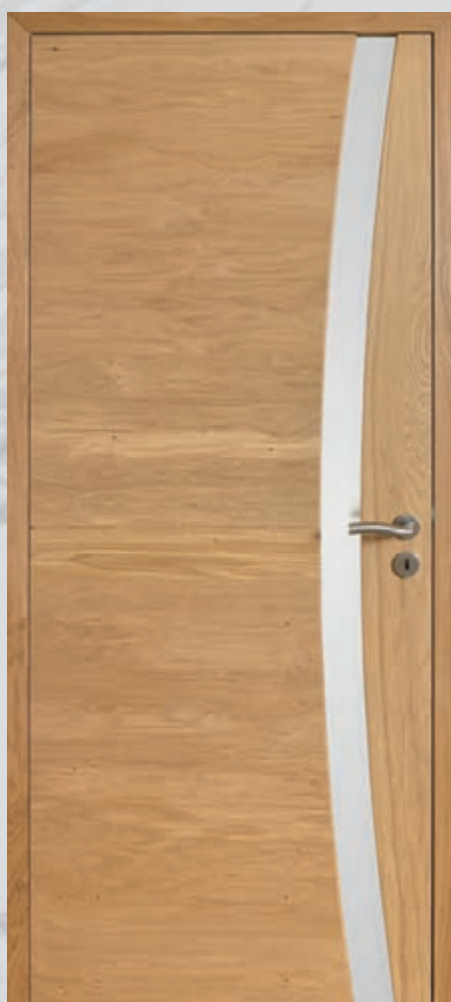
Modèle présenté : Sirocco®, Chêne sélectionné naturel brossé