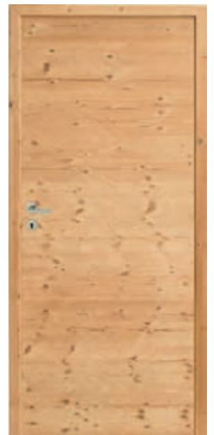
Epicéa thermo-chauffé brossé

Indications et photographies non contractuelles, voir p. 94