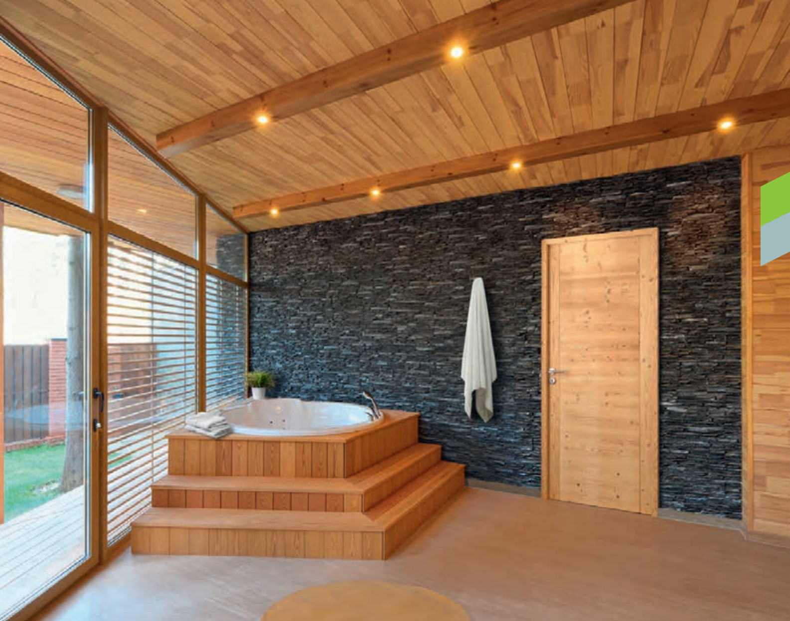
Aravis, Epicéa thermochauffé